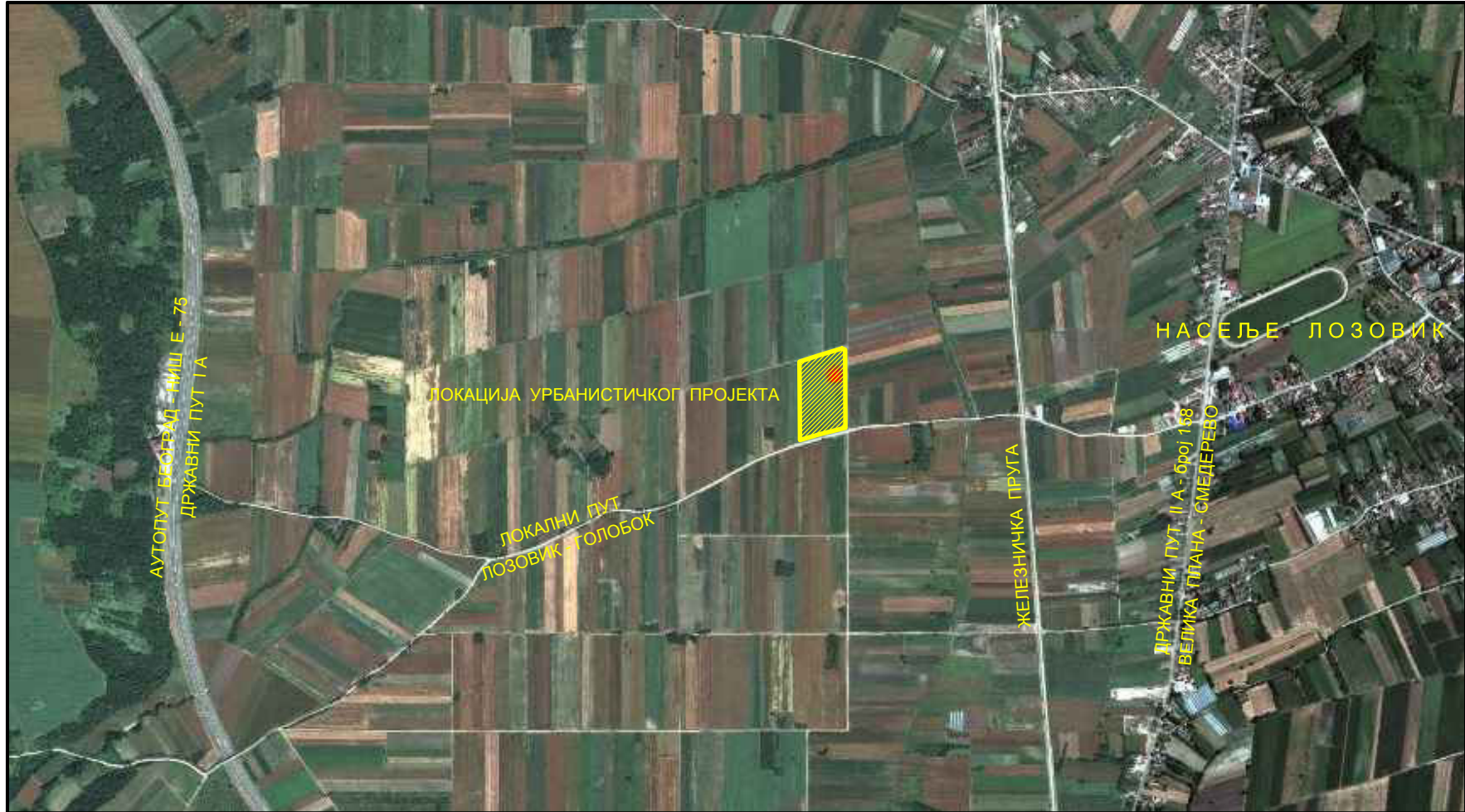
ШИРА СИТУАЦИЈА ПРЕДМЕТНЕ ЛОКАЦИЈЕ