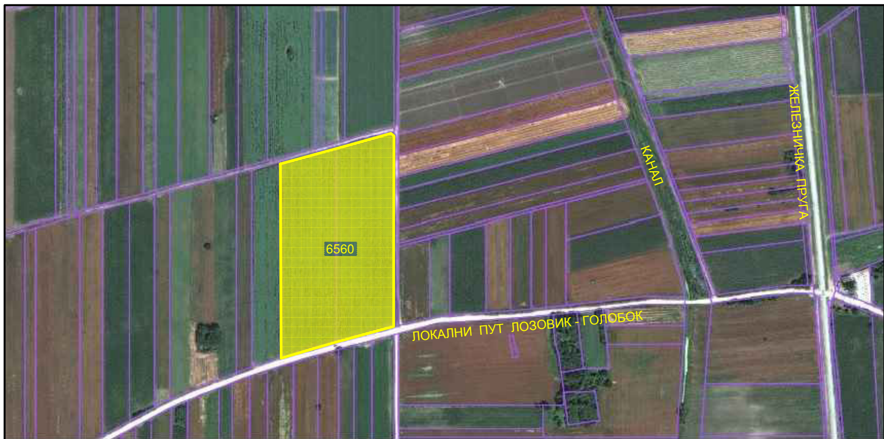
УЖА СИТУАЦИЈА ЛОКАЦИЈЕ